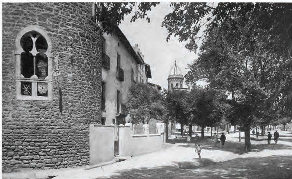
6. TREMP - Passeig d'en Prat de la Riba

«D'ençà d'aquells dies, les imatges de les nostres parets romàniques m'han acompanyat, gairebé perseguit, en les més remotes parts del món. Tenen cares astorades que m'obsessionen; fan gestos violents que desconcerten; mouen els membres, sobretot les mans, com si estiguessin desllorigades. Molt sovint m'he preguntat quina és la causa de la fascinació que produeixen aquestes pintures romàniques nostres i quin és el lloc que els correspon en el patrimoni artístic de la humanitat. Queda sempre el dubte de si seran només estimades per llur ferotge primitivisme i no per llurs positives qualitats estètiques.»